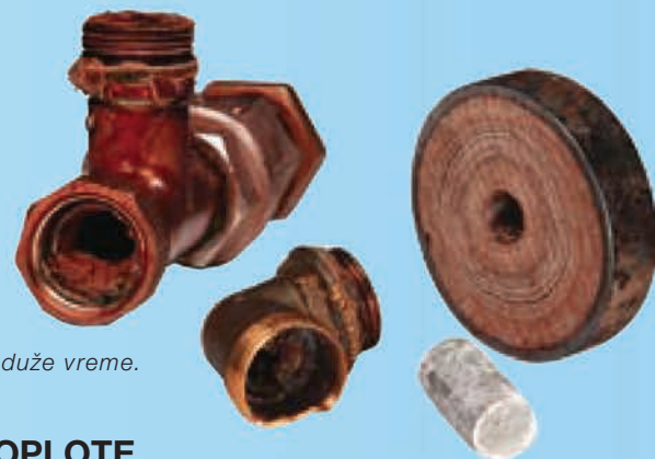
Cevi i oprema koja je bila izložena vodi sa kamencem duže vreme.

Dekalcifikator 1. se montira na dolaznu glavnu cev 2. gde on generiše elektrostatičko polje između polova 3. Impulsi polja su između 7000 i 14000 Hz. Kada voda teče kroz polje, postojeće čestice gvožđa se pokreću velikom brzinom, što razlaže kamenac 4, sprečavajući ga da stvori naslage 5. Elektrostatičko polje je uvek 100 posto efikasno jer se kontinuirano isporučuje sa potrebnim naponom. Potrošnja energije je zanemarljiva. Aqua Dekalcifikator ne sadrži pokretne delove i potpuno je bez održavanja. Testiran je od strane docenta Allan Jerbo. Izveštaj o ispitivanju i reference su dostupne na zahtev.