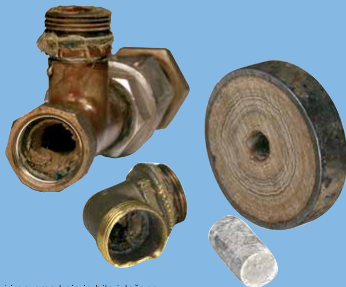
Cevi i oprema koja je bila izložena vodi sa kamencem duže vreme.